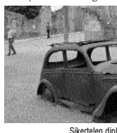
Sikertelen diplomácia nyomában