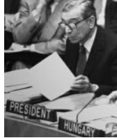
Erdős André (jobbra, lent) Magyarországot képviselve

– Ez mindig kézzel fogható pozitívumokkal járt sz-