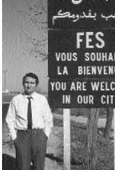
Fez – Marokkó

– A Duna Televízióban immár egy éve külön sorozatban foglalkozom – saját videófelvételeim segítségével is – a világ dolgaival. Ugyanis nagyon szeretek filmezni. A helyszínen voltam Guinea északkeleti, a Muzoiok földjén Tanzaníában, az éppen csak függetlenségét elnyert Maputo utcáin, Marraekhei bazárjaiban, észak-amerikai indiánok tünccsüvegében, a mexikói piramisoknál, a delindiai előlétásvizorok előtt, Havanna régi negyedében, a japán cserecsinye-feljárásokon, és a csodálatos Persepolisben, Tibolisi roszakat régi utcáin, a libanoni cédrusoknál, a többemeletes